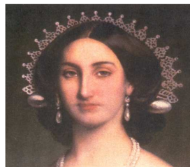
La Regina Carlotta D'Asburgo con la sperada omaggio delle donne lombarde

Nel settembre del 2006 il Museo Carlo Verri di Biassono, in linea con la volontà di mantenere vivi i legami con la storia e la cultura del nostro popolo, ha inaugurato al suo interno, l'angolo del costume di Brianza dove